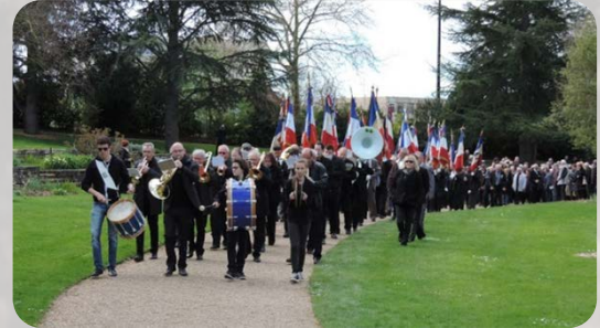
Participations aux cérémonies officielles