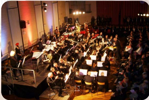
Échanges fréquents avec des harmonies régionales et nationales