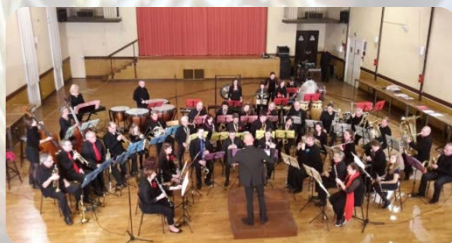
Projets personnels : enregistrement