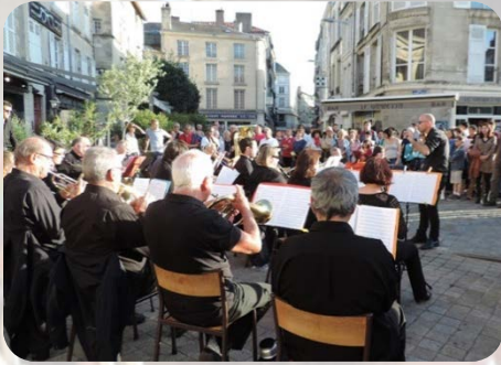
Participations à la vie locale : fête de la Musique