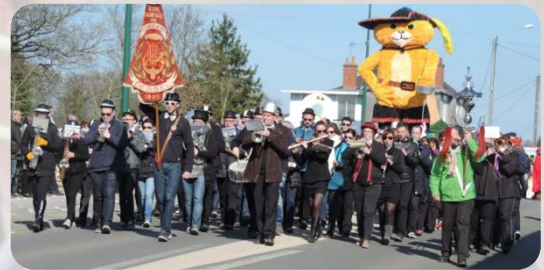
Échanges réguliers avec orchestres étrangers : Carnaval de Rouillé avec la Fanfare Royale Belge de Dessel