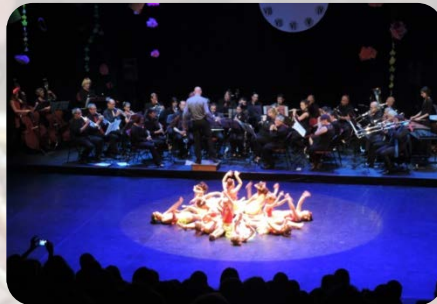
Partenariats associatifs : spectacle de fin d'année de Flex Pointe